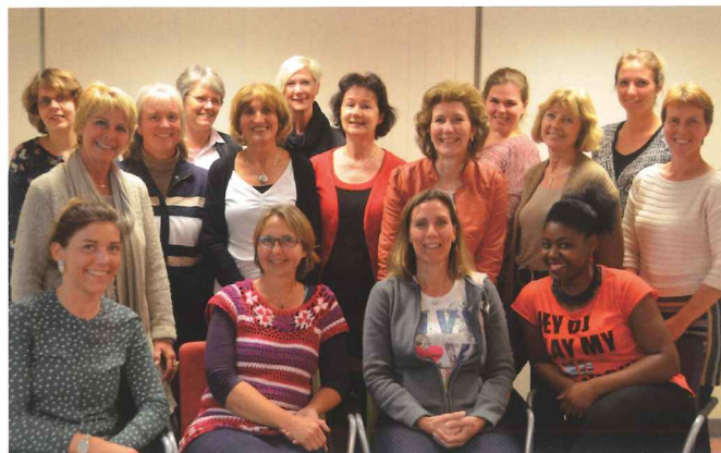
Deel van de diëtisten aangesloten bij Zorggroep West Alblasserwaard.

De diëtist kan cliënten helpen met (preventieve) voedingsadviezen, maar kijkt ook naar de participatie en psychosociale omgeving van een cliënt. Door de inzet van een eerstelijns diëtist kan worden voorkomen dat een cliënt direct in de tweede lijn terecht komt. Steunpunt KOEL is momenteel bezig met het een project waarin diëtisten ondersteund worden in hun profilering en een duidelijkere rol krijgen in de eerstelijns zorg.